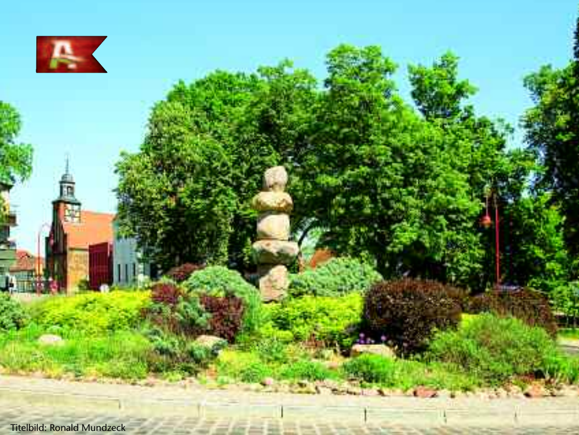
Titelbild: Ronald Mundzeck