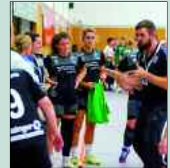
Während einer Auszeit werden die Spielerinnen neu justiert.