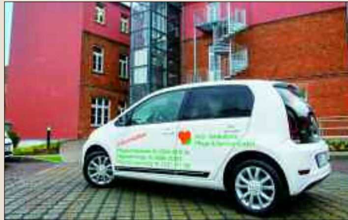
Wenn etwas für ältere und pflegebedürftige Menschen wichtig ist, dann ist es Gesellschaft, deshalb ist das Angermünder Pflegeteam mobil.

Neben einer kulinarischen Versorgung bot sich den Gästen am Tag der offenen Tür ein Markt der Möglichkeiten. Regionale Gesundheitsdienstleister wie Sanitätsfachgeschäfte oder Home-Care Unternehmen informierten zu