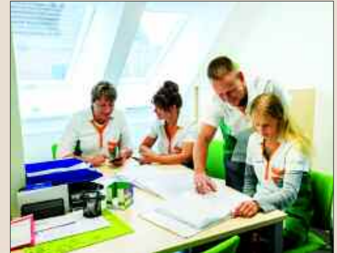
Engagiert bereiten die Mitarbeiter und Mitarbeiterinnen der Tagespflege des Angermünder Pflegecampus den Tag für ihre Gäste vor.