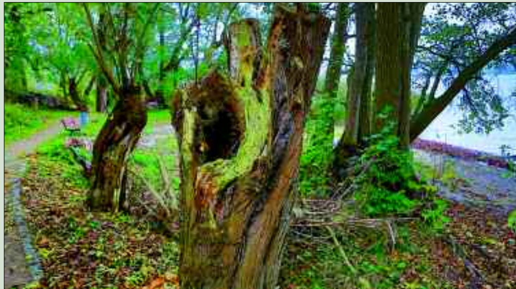
Idylle pur: Der Wolletzseerundwanderweg führt 16,5 Kilometer durch die Natur.

Wolletzsee – siehe Seite 27. Nach einer recht turbulenten Geschichte der Liegenschaft am Wolletzsee – es war Adelsitz, deutsch-amerikanisches Liebesnest, Jagdschloss, FDJ-Heim und Mielke-Domizil – wurde hier 1990 eine Rehaklinik eingerichtet.