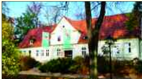
Der Sitz der Geschäftsstelle Angermünde der VS beinhaltet auch die Begegnungsstätte.

sensvorsorge im ländlichen Raum. Deshalb kommt der Zusammenarbeit der Volkssolidarität mit den ehrenamtlich und freiwillig Engagierten eine wachsende Bedeutung zu. Sie sind ganz wichtige Unterstützer, wenn Hilfe für Menschen erforderlich wird. Für sie organisiert die Volkssolidarität regionale Schulungen,