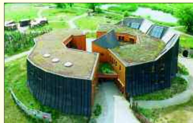
Der „hohle Baumstumpf“ hat es in sich! Das NABU-Infozentrum Blumberger Mühle, dessen Architektur einem solchen Baumrest nachempfunden ist, bietet den Besuchern im Inneren viel Wissenswertes über das Biosphärenreservat Schorfheide-Chorin.

Im Hauptgebäude – architektonisch einem Baumstamm nachempfunden – wird spannend und recht informativ ganz viel über Landschaft und Entstehungsgeschichte vom Naturschutzgebiet erzählt. Schaubilder, Tafeln und Modelle