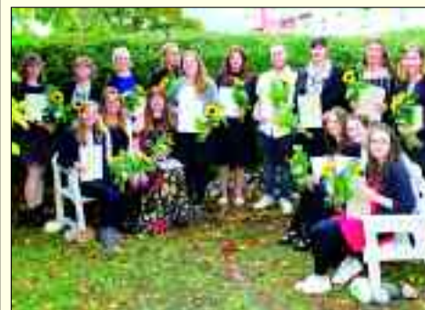
Stolz präsentiert die Abschlussklasse 2019 ihre Zeugnisse nach drei interessanten und arbeitsreichen Jahren.