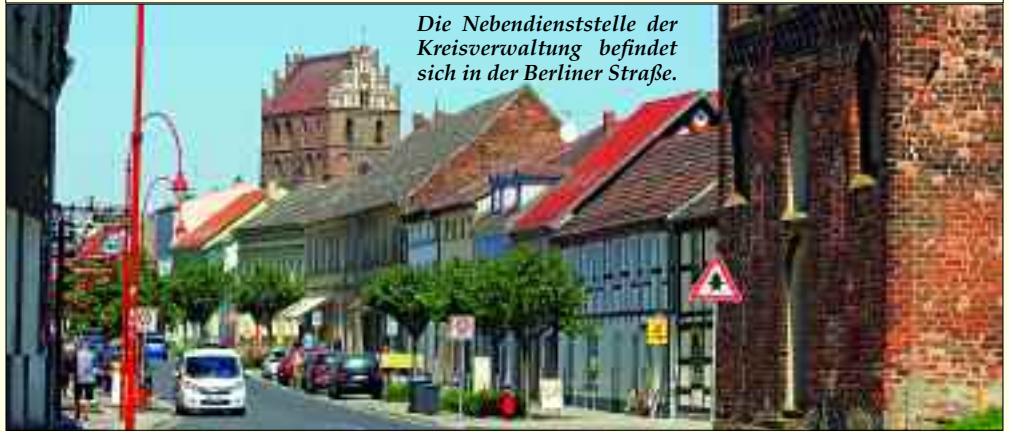
Die Nebendienststelle der Kreisverwaltung befindet sich in der Berliner Straße.