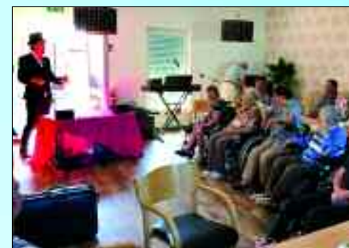
Vielfältige Aktivitäten, wie die Zaubershow zum Sommerfest, lassen keine Langeweile aufkommen.

Ambulanter Pflegedienst • Inhaber Olaf Roxlau Straße des Friedens 1 • 16278 Angermünde • Tel. 033 31/7 29 96 58 • Fax 033 31/7 29 76 22 Mobil 01 72/4 25 13 93 • barum-pflege@outlook.de