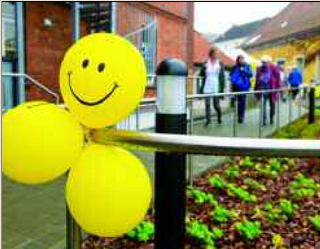
Der 24. Oktober 2019 wird sicher nicht so schnell vergessen, war der Tag der offenen Tür zur Eröffnung ein voller Erfolg!

Schulgebäudes und zwischenzeitlichen Flüchtlingsheims gibt es nun auf insgesamt 1.000 Quadratmeter Fläche zwei Wohngemeinschaften mit je sechs Plätzen für pflegebedürftige Menschen, darüber hinaus eine 24-Stunden-Intensivbetreuung für Menschen mit einer Trachealkanüle und/oder Beatmungspflichtigkeit sowie 15 Tagespflegeplätze.