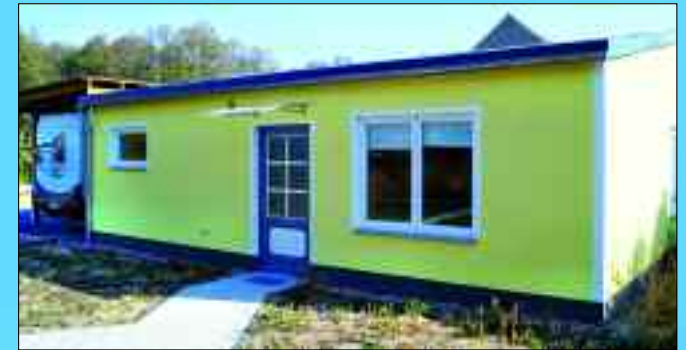
Das kleine Veranstaltungshäuschen wird von den Bewohnern gern für Geburtstagsfeiern und anderen Festen genutzt.

Vielfältige Betreuungs-, Beschäftigungs- und Freizeitmöglichkeiten sorgen für viel Abwechslung im Alltag. Die Senioren werden dabei unterstützt, ihren Tagesablauf