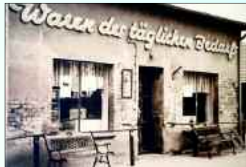
Aus alt mach neu: Der alte Dorfladen von Pinnow (oben) bekommt ab nächstes Jahr eine neue Bestimmung – Seniorenheim.

Pflegebedürftige und deren Angehörige finden seit über fünf Jahren in der Straße des Friedens 1 eine zentrale Anlaufstelle. Das Jubiläum Anfang