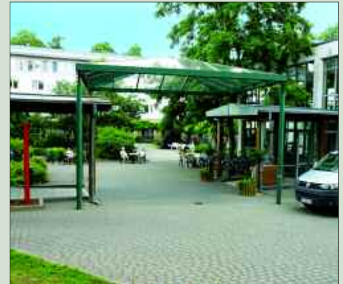
Hof der GLG Fachklinik Wolletzsee. Hier erholen sich heute Menschen nach neurologischen Erkrankungen oder mit Gefäßleiden sowie Herzproblemen.

Allerdings ist Wolletz dann doch nicht so der verschlafene Ort. Große Sport- und Kulturveranstaltungen finden hier statt. Im Strandbad Wolletzsee startete im Jahr 2019 beispielsweise der Schorfheide-Triathlon und Quadrathlon. Der Volleyball Club Angermünde war Gastgeber für das Beach-Camp. Es gab zudem das Pepsi-Cup-Volleyballturnier sowie das Drachenboot-Rennen mit Kinderstrandfest. Im August 2019 wurde im Strandbad laut gefeiert. Die Städtischen Werke Angermünde und der Angermünder Kulturverein waren Gastgeber für das 11. Energie Open Air am Ufer des Sees. Das Energie Open Air ist mehr als nur einfach ein Konzert. Seit mehr als zehn Jahren zieht es immer Ende August tausende Besucher in das Strandbad Wolletzsee. Das Festival gehört mittlerweile zu den größten open-air-Veranstaltungen im Land Brandenburg. Es ist ein großes Familienfest, bei dem man alte Freunde und Verwandte trifft und gemeinsam einen schönen Tag mit toller Musik und groß-