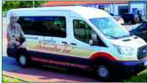
Der Hol- und Bringedienst der Tagespflege „Am Schwedter Tor“ ist sehr beliebt.

Im Jahr 2020 steht der Tagespflege „Schwedter Tor“ das fünfjährige Jubiläum bevor. Das soll natürlich zünftig gefeiert werden! Seit 2015 gibt es nun von 8 bis 15.30 Uhr beste Betreuung, Gemeinsamkeit, Unterhaltung und Lebensfreude. Die Tagespflege ist in dieser Zeit zu einen fester Bestandteil im sozialen Leben in Angermünde geworden. Ein Fahrdienst holt die Gäste ab und bringt sie wieder nach Hause. Drei Mahlzeiten am Tag sind selbstverständlich.