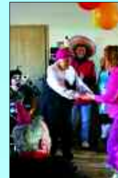
Partytime: Beim Faschingsfest war ordentlich was los (li.) Abwechslung: Ausflug zum Griechen (re.)