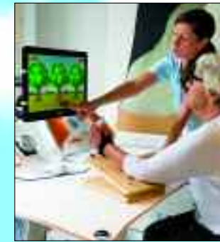
Mit modernster Technik und professionellen Mitarbeitern zum Wohl der Patienten.

In der GLG Fachklinik Wolletzsee hat die Gesundheit oberste Priorität. Nach neurologischen Erkrankungen oder Gefäßleiden sowie Herzproblemen werden die Patienten hier mit modernsten Methoden und in familiärer Atmosphäre wieder fit gemacht für den Alltag in ihrem Zuhause. Das sehen Besucher übrigens schon auf den ersten Blick: Wolletz trägt stolz das Qualitätssiegel „TOP Rehaklinik 2020“ für die beiden Fachbereiche Neurologie und Kardiologie. Zum Einsatz kommen neben den klassischen Angeboten mit Physiotherapie, Sport- und Bewegungstherapie, Physikalischer Therapie sowie Ergotherapie und Sprachtherapie auch spezielle Formen. Unter anderem werden in Wolletz computergestützte