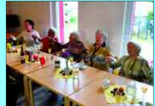
Mit Elan dabei: Die Bewohner und Bewohnerinnen der bestehenden drei Einrichtungen von BAR/UM sind mit Freude und Elan bei der Sache.

Das Angebot für die Pflegebedürftigen und pflegenden Angehörigen wird in den beiden Landkreisen Barnim und Uckermark angeboten und gewährleistet ein hohes Niveau in der Pflege. Der Pflegedienst steht mit seinem Team, darunter vorwiegend examinierte Pflegefachkräfte mit dreijähriger Ausbildung, als Partner allen Hilfesuchenden zur Seite. Neben der „normalen“ Pflege bietet das Unternehmen auch eine intensivpflegerische Betreuung an. Das Angermünder Pflegeteam versteht sich auch auf onkologische Pflege bei Krebspatienten sowie auf palliative Pflege, die begleitenden Pflege zum Lebensende. Neben Schmerz- und Infusionsmanagement übernehmen die Spezialisten von BAR/UM dank Expertenwissen zur Ernährung auch das Ernährungsmanagement der Pflegebedürftigen. Bei Bedarf erstreckt sich das sogar auf die Ernährung mittels Ma-