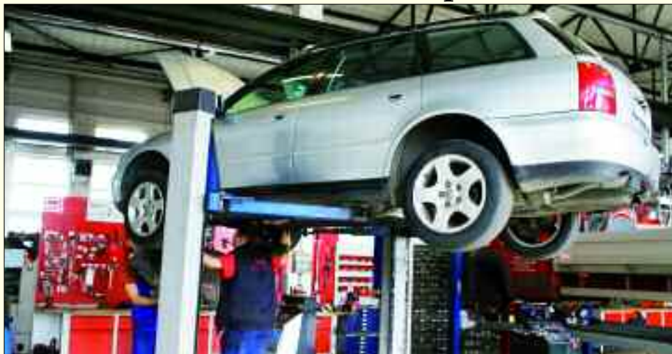
Das Team der Engelsdorfer Fahrzeugbau GmbH bietet eine große Bandbreite von Leistungen an.

Die Engelsdorfer Fahrzeugbau GmbH – besser bekannt als EFB – ist eine absolute Spitzenwerkstatt für PKW und LKW. Das bestätigt ein anonymer Werkstatttest, der im Auftrag der Robert Bosch GmbH durch ein