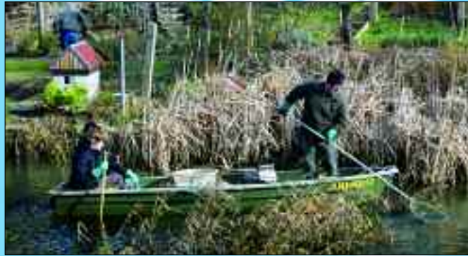
Der Anglerverband Leipzig bewirtschaftet über 8.400 Hektar.

In der Villa der ehemaligen Wellpappenfabrik in der Engelsdorfer Straße 377 befindet sich seit 2009 die Geschäftsstelle des Anglerverbandes Leipzig. Mit seinen mittlerweile sieben hauptamtlichen Mitarbeitern ist der Verband für die fischereiliche