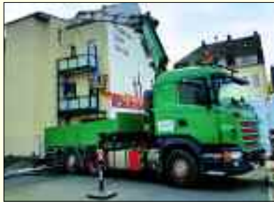
Der Transport und die Montage von Balkonen gehört zu den neueren Geschäftsfeldern.