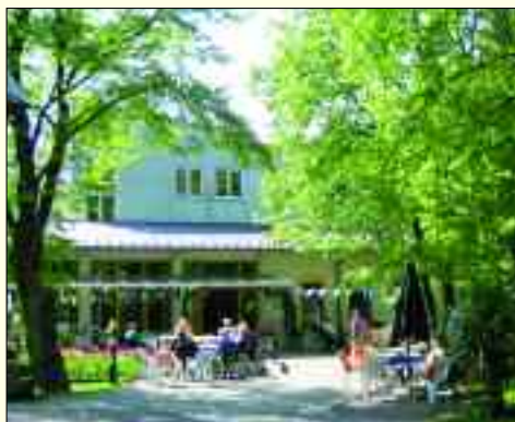
St. Gertrud punktet auch durch seine familiäre Atmosphäre und seine idyllische Lage im Park.

Zur Frühstückszeit werden die Bewohnerinnen und Bewohner im Caritas-Altenpflegeheim St. Gertrud täglich mit einem herzlichen Guten Morgen begrüßt und dabei über die vielseitigen Veranstaltungsangebote informiert und dazu eingeladen. Täglich können die Bewohner aus sozialen Angeboten wählen, wie zum Beispiel Gedächtnistraining, Zeitungsschau, Kreatives Gestalten, Spiel-, Spaß- und Singerrunden. Einmal die Woche wird zum Tanzen im Sitzen eingeladen, was besonders begeistert angenommen wird. Musik nimmt im Haus einen großen Platz ein. Viele Bewohner sind an Demenz erkrankt und sprechen besonders auf Musik an. Auch bei den verschiedenen Feiern wird daher immer gern gesungen und geschunkelt. Die zahlreichen Angebote und Veranstaltungen werden durch eine Vielzahl von ehrenamtlichen Helfern unterstützt. Zwischen Helfern und Bewohnern entsteht häufig eine recht persönliche Beziehung, so dass sich dadurch die sozialen Kontakte der Bewohner spürbar erweitern. Langweilig wird es nie – in St. Gertrud ist immer etwas los!