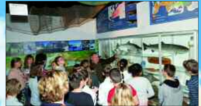
Schul- und Hortklassen bietet die Fischwelt interessante Einblicke.

Vereine des Verbandes anzumelden, oder sich bei Bedarf eine Tagesangelkarte für das gewünschte Gewässer zu kaufen.