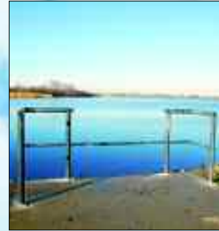
Behindertengerechter Angelplatz in Kleinpösna

ten wird. Letzte Hürde ist dann noch eine Prüfung, die in Sachen bei der DEKRA durchgeführt wird. Mit dem Fischereischein hat man dann die Möglichkeit, sich in einem der