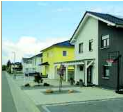
RUBA hat in Baalsdorf attraktive Häuser im Gottlieb-Schöne-Weg errichtet.

Die RUBA Hausbau GmbH ist ein ostdeutsches mittelständiges Bauunternehmen, das im Jahr 1995 gegründet wurde. Seit Anfang an fühlt sich das Unternehmen der Region verpflichtet und ist deshalb hauptsächlich im Süden und Osten Leipzigs tätig. Durch überzeugende Qualität und Leistung konnte RUBA dort seine Marktposition ständig ausbauen. Das vorrangige Leistungsangebot liegt in der Entwicklung von neuen Wohngebieten, Planung und Herstellung von Massiv- und Fertigteilhäusern sowie Gewerbebauten. Alle Arbeiten rund ums Bauen werden für den Baukunden aus einer Hand erledigt. Das RUBA-Team errichtet Einfamilienhäuser mit kompletter Betreuung, von der Bauidee bis zum Einzug zur vollen Zufriedenheit der Bauherren. Beispiele dafür finden sich in der Diamant-/Jaspisstraße in Engelsdorf und im Gottlieb-Schöne-Weg in Baalsdorf. Viele Kunden nutzen den kostenlosen Finanzierungsservice des Unternehmens. Aktuell errichtet RUBA freistehende Einfamilienhäuser im Wiesenblumenweg in Leipzig-Holzhausen.