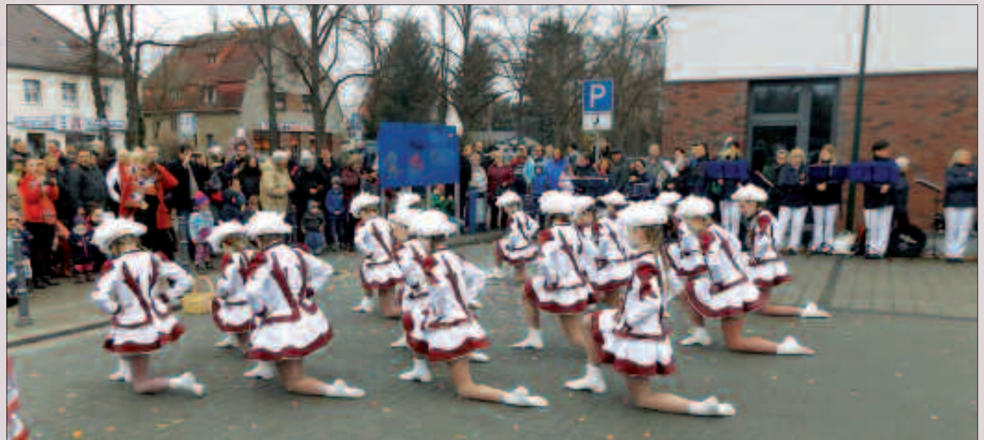
Gardeauftritt bei der Schlüsselübergabe vor dem Rangsdorfer Rathaus am 11.11.2023

stands ein Gemischter Chor geschaffen. Proberäume waren das Waldrestaurant beziehungsweise das Ferienobjekt des Holzbaus Sebnitz. Auf Grund des 25-jährigen Bestehens des Gemischten Chores gab es 1998 im Rahmen der Rangsdorfer Festwoche ein Konzert im Seebad. Zu Gast waren der Frauenchor Mahlow, der Männerchor Rehagen und der Gemischte Chor Großbeeren.