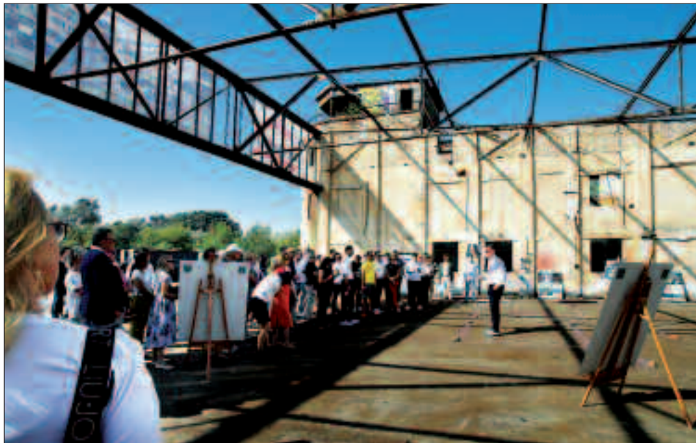
Die rund 250 Gäste wurden in drei Gruppen über das Areal geführt.