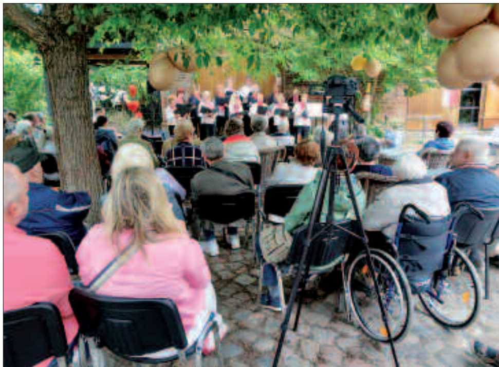
Pfingstsingen in der Kulturscheune Rangsdorf.

Die Sparte Chor trifft sich jeden Montag von 18 bis 20 Uhr in der Seniorenresidenz.