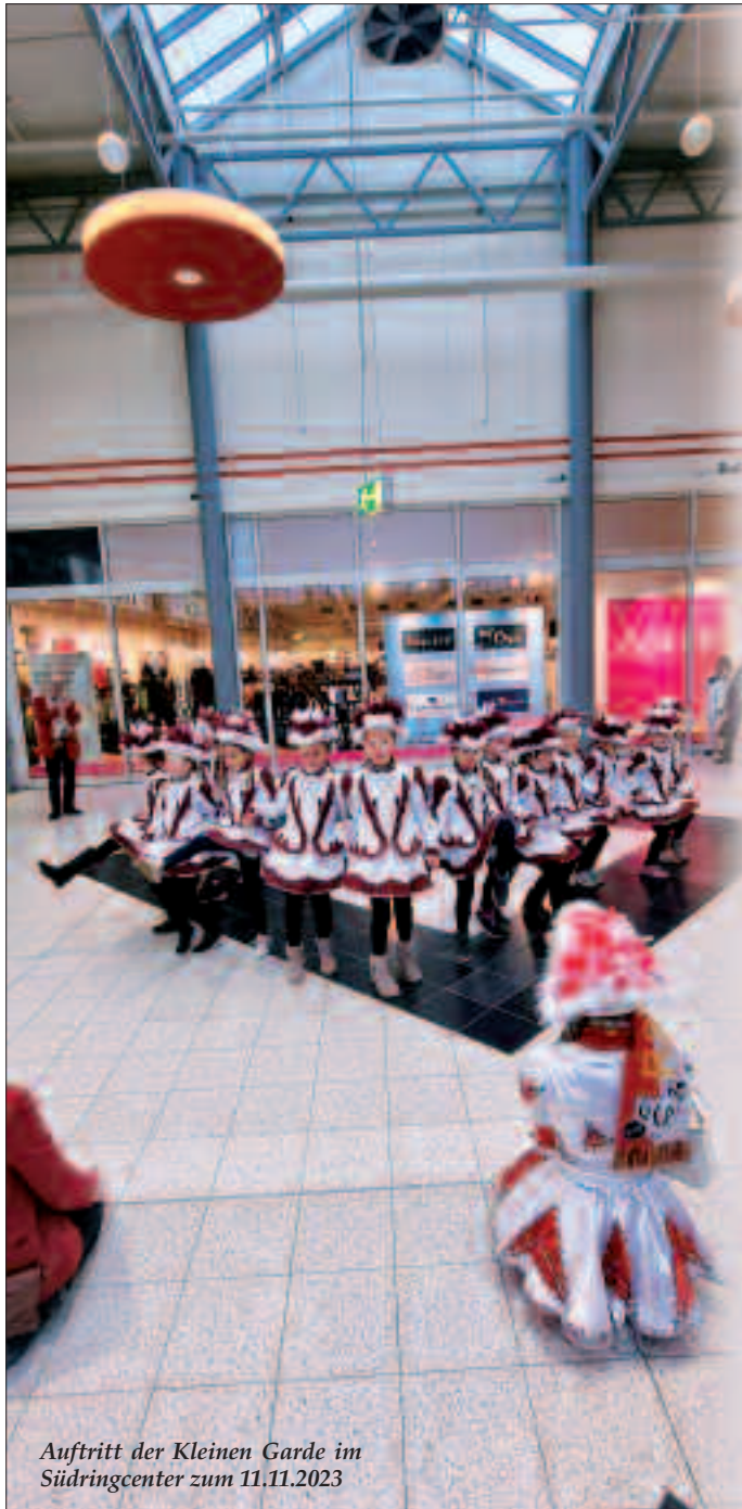
Auftritt der Kleinen Garde im Siedringcenter zum 11.11.2023