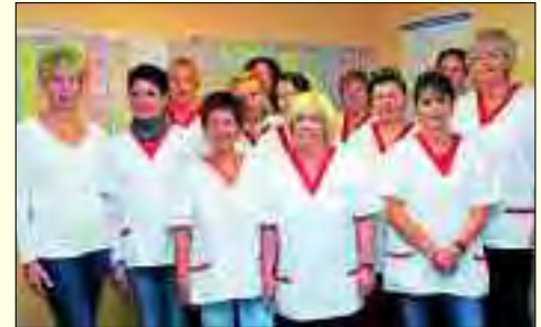
Wiederholt Note 1 für die AWO-Sozialstation.

Die AWO-Sozialstation Am Marienberg ist seit 1990 eine bekannte Adresse für Menschen, die im Alter oder durch Krankheit professionelle Hilfe benötigen. Natürlich werden spezielle Wünsche und Bedürfnisse der Patienten berücksichtigt. Die Station arbeitet seit vielen Jahren mit einem festen Mitarbeiterstamm, der weiß, worauf es im Umgang mit dem Patienten ankommt. Die Betreuung ist so strukturiert, dass der Schwerpunkt auf die individuelle Pflege des Einzelnen gelegt wird. Durch diese umfassende Versorgung kann der Erhalt der eigenen Wohnsituation so lange wie möglich gesichert werden. Die AWO-Sozialstation Am Marienberg ist Vertragspartner aller Kassen und Pflegekassen. Das Angebot erstreckt sich über die Behandlungspflege jeglicher Art, alle Leistungen aus dem Katalog der Pflegekassen sowie zusätzliche Betreuungsleistungen für Patienten mit eingeschränkter Alltagskompetenz. Selbstverständlich können auch Privatleistungen vereinbart werden. Schwerkranken, palliativ zu versorgende Patienten profitieren von der intensiven Pflege in der gewohnten,