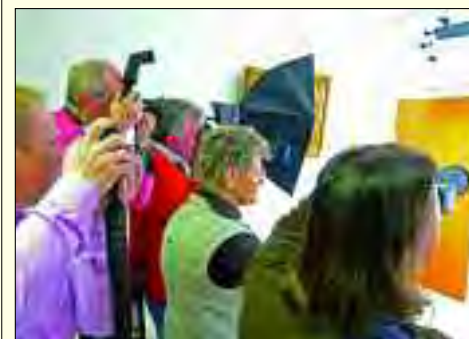
Workshop im Studio

Fotoclub auch im Internet präsent, so mit einer jährlich erneuerten Fotoschau. Seit 2011 beteiligt sich der Fotoklub mit ausgewählten Bildern am jährlichen Fotoklubforum, einer Ausstellung vieler Berliner und weiterer Fotoklubs im Rathaus Köpenick von Anfang März bis Anfang Mai. In der Wanderausstellung 2013 des Fotoklubs sind die 30 besten Fotos, die 2012 aus Anlass des 300.