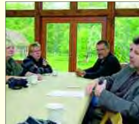
Workshop im Oderbruch

Im Januar 1999 gründeten 21 interessierte Hobbyfotografen den Fotoclub Strausberg. Der Fotoclub ist eine Interessengruppe im Märkischen Kulturbund Strausberg. Gegenwärtig zählt der Klub 28 Mitglieder im Alter von 39 bis 80 Jahren mit unterschiedlichen Berufen und fotografischen Interessen. Zu den monatlichen Klubtreffen werden Erfahrungen ausgetauscht und neueste Fotos diskutiert. In den letzten Jahren vollzogen alle Klubmitglieder den Übergang zur digitalen Fotografie. Seminare mit Gastreferenten, wie Berufsfotografen, bereichern die informative Weiterbildung.