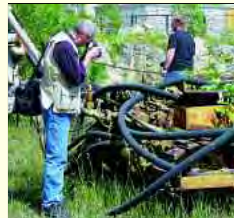
Fotoexkursion im Museumspark Rüdersdorf

Der jährliche Arbeitsplan beinhaltet neben den monatlichen Klubtreffen auch Erfahrungsaustausche der Interessengruppen „Digitale Fotografie“ und „Bildbearbeitung“ sowie Fotoexkursionen und -ausstellungen. 17 thematische Fotoausstellungen des Fotoklubs wurden seit 1999 an verschiedenen Orten in Strausberg, beispielsweise in den Kundenzentren der Stadtwerke Strausberg und des Wasserverbandes, im Krankenhaus Strausberg, der Seniorenresidenz am Straussee, aber auch überregional einer breiten Öffentlichkeit präsentiert. Natürlich ist der