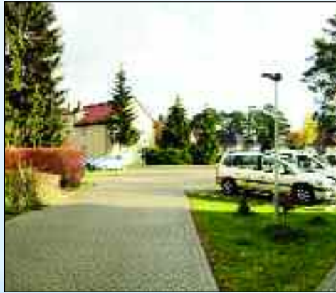
Der im Jahr 2015 neu gestaltete Hof der Paul-Singer-Straße 3 bis 5 in Strausberg.

Mehr als 60 Jahre gutes Wohnen in Strausberg und Hennickendorf – dafür steht die 1954 gegründete Wohnungsbaugenossenschaft „Aufbau“ Strausberg eG. Mit einem Bestand von mehr als 1.340 Wohnungen gehört sie zu den größten Wohnungseigentümern in Strausberg. Durch zahlreiche Investitionen in den letzten Jahren konnte dem Wunsch nach gutem, zeitgemäßem und altersgerechtem Wohnen nachgekommen werden. Nachträglicher Einbau moderner Aufzüge in den Wohngebieten Am Marienberg und Otto-Grotewohl-Ring, die energetische Sanierung der denkmalgeschützten Seehaus-Siedlung und der Neubau des „Sonnenhauses“ im Gustav-Kurtze-Wohnpark sind nur einige Beispiele. Neue Herausforderungen für 2016 sind unter anderem die Strangsanierung der Elektro-Installation im Wohngebiet Am Försterweg, der Einbau weiterer Aufzüge Am Marienberg und im Otto-Grotewohl-Ring und die Sanierung weiterer Häuser in der Seehaus-Siedlung. Das Besondere am genossenschaftlichen Wohnen ist, dass man nicht nur Mieter sondern auch Mitglied ist und damit selbst Miteigentümer der Genossenschaft. Das bedeutet, man hat ein Mitspracherecht und damit den Vorteil, dass sich die Genossenschaft an den Interessen der Mitglieder orientiert. Aus den Reihen der Genossenschaftsmitglieder werden Vertreter mit einem direkten Mitspracherecht und Mitbestimmungsrecht gewählt. Sie erhalten in